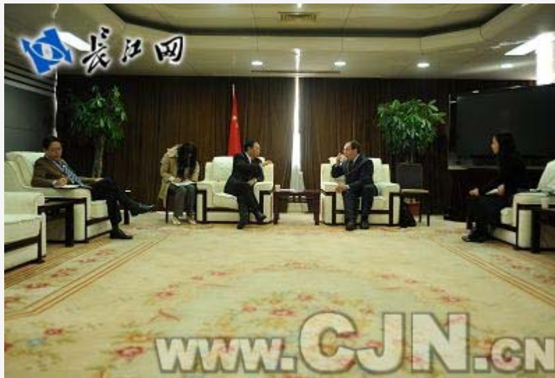
贾耀斌会见加拿大魁北克省光电子协会首席执行官米歇尔·特图

张哲一）今日（11月3日）上午，武汉市委常委、东湖高新区党工委书记贾耀斌在武汉科技会展中心会见了加拿大魁北克省光电子协会首席执行官米歇尔·特图，双方就光电子产业的合作发展进行友好交谈。